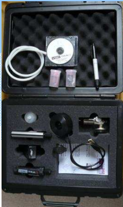
VOC-TRAQ et sa mallette accessoires